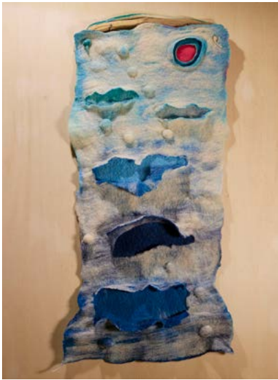
M a Soledad Soberado "OCÉANOS"