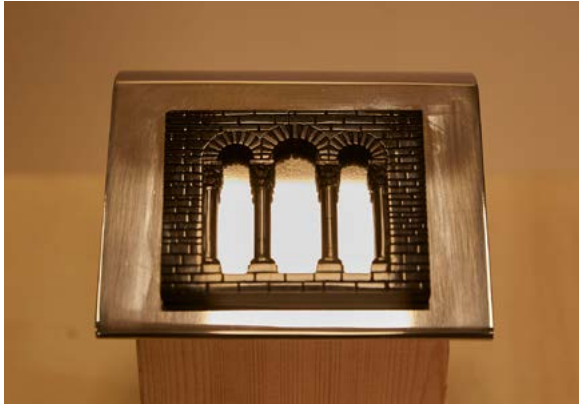
Acebache Llantones "VENTANA TRÍFORA DE SAN TIRSO"