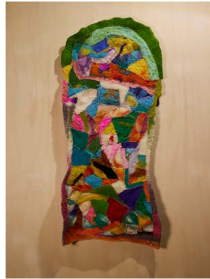
M a Soledad Soberado "DIVERSIDAD EN PEDAZOS"