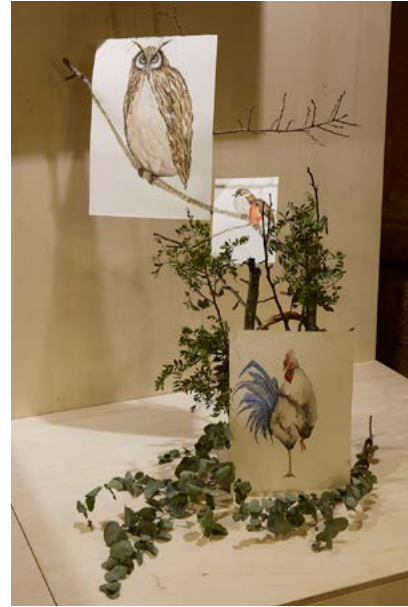
Isabel Soberado Rodríguez "NATURAL-MENTE"