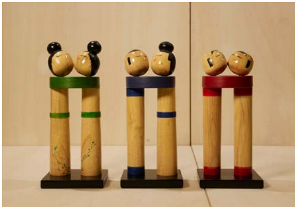
Vanessa de la Campa Paz "ABRAZOS DIVERSOS - DIVERSOS ABRAZOS"