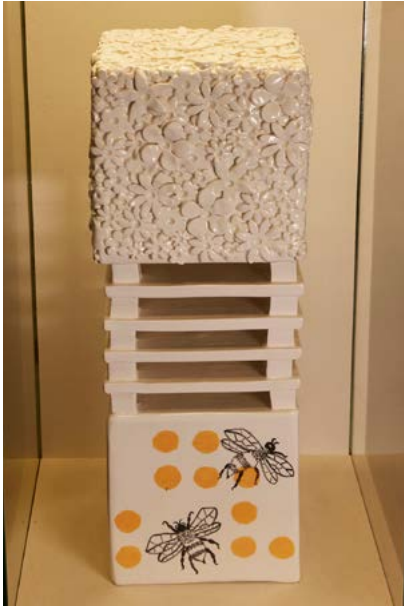
Cécile Brillet "DE ALQUILER"