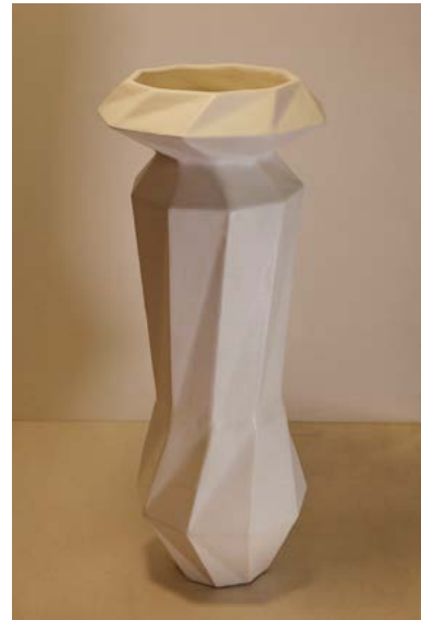
Woodic "EDRA TOTEM BLANCA"