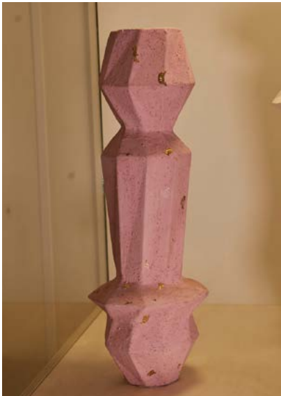
Woodic "EDRA TOTEM PINK"