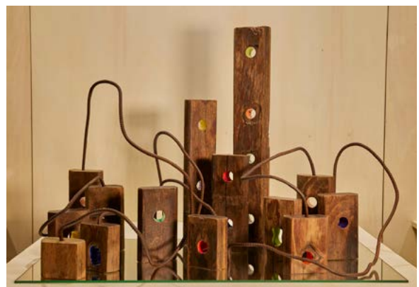
Javier Ruíz-Cuevas Montes "DURMIENTES"