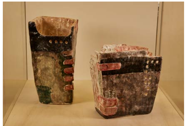
Nuria Pozas Corredera "PAISAJES URBANOS"